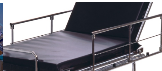
Sidogrindar, par (tillbehör)