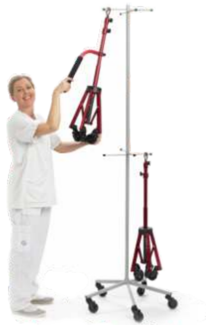
Praktisk att förvara