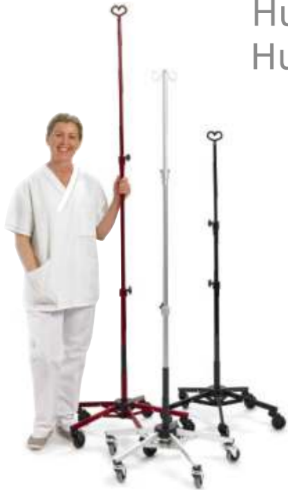
Stabil och funktionell

Hur förvarar man så många som 16 infusionsställ på en yta av 0.5 m 2 ? Hur transporterar och bär hemsjukvårdaren ett infusionsställ på ett effektivt sätt?