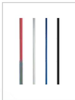
Exempel på färger

Höjd Lägst 85 cm. Högst 215 cm. Avser 3-delad modell.