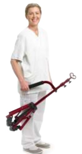
Lätt att bära