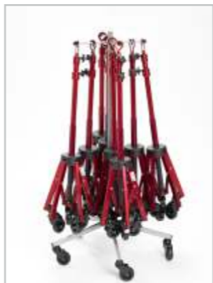
1-våningsrack med åtta VIOLETTA