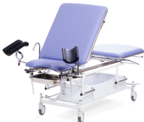
Modell 016-2050 plus patienthandtag 010-2033.