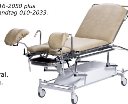
Vår Kombigyn kan också användas som vanlig brits. Benstöd och patienthandtag är borttagbara.