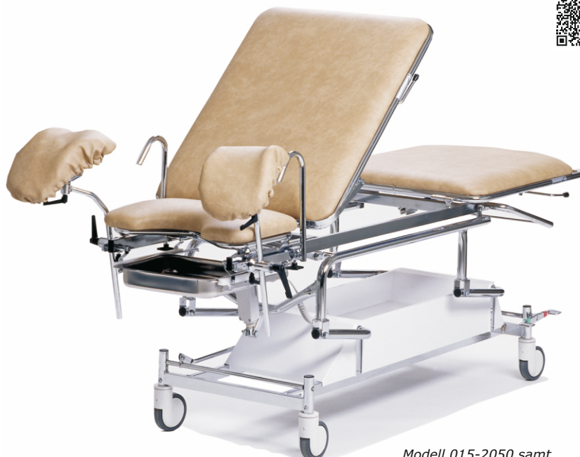
Modell 015-2050 samt patienthandtag 010-2033.

Rätten till konstruktionsändringar förbehålles