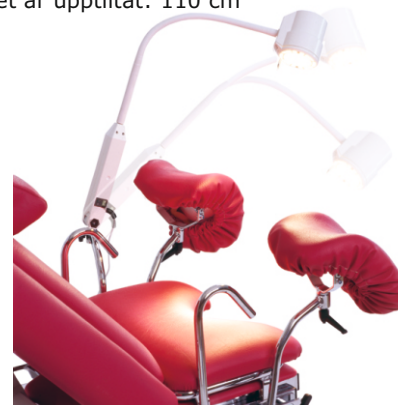
De undersökningslampor vi säljer kan monteras direkt på Kombigyn-britsen.