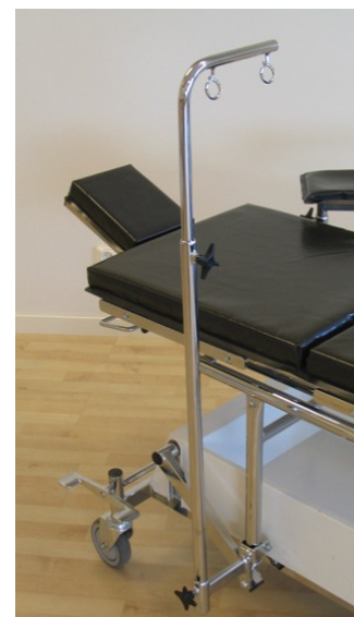
Tillbehör: Narkosbåge, armstöd med dyna samt infusionsstativ