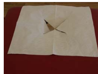
Passar till bänkar med huvudstöd... men även modell med ansiktshål.